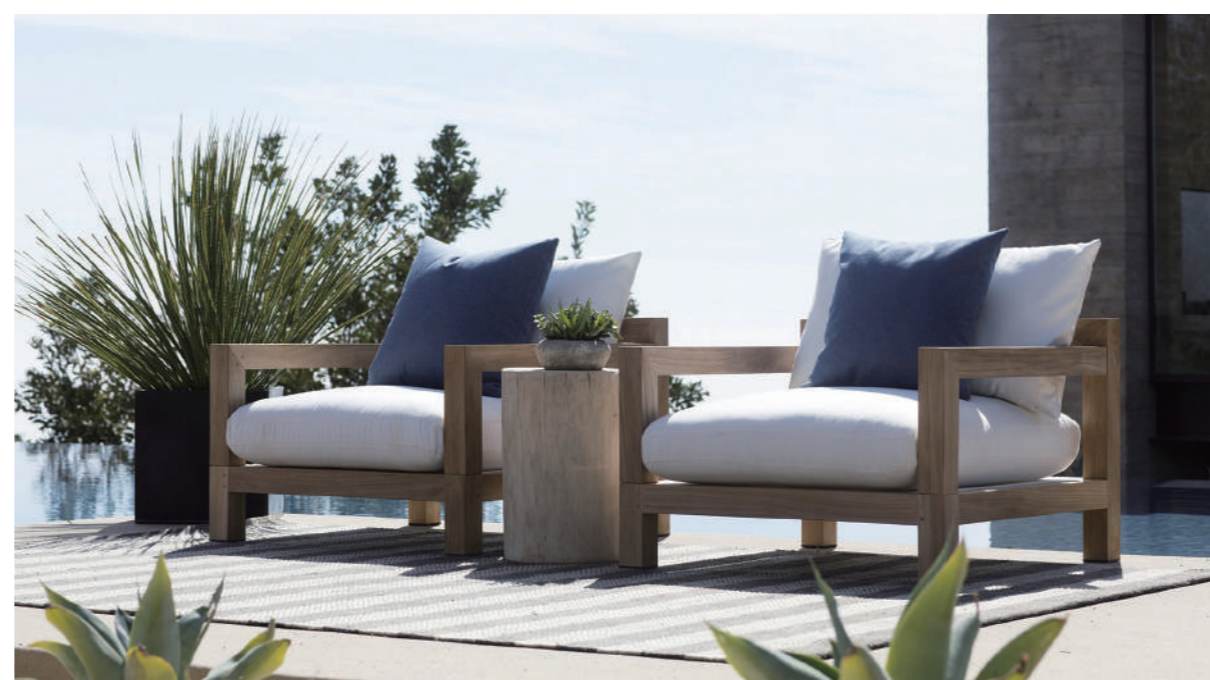
日差しを遮って爽やかな風を感じるパラソル。また、テーブルとソファ、ベンチなどゆったりと時間を過ごすための必須アイテムです。リビングルームからつながる我が家のテラスをリゾート空間に。

いつ、誰と、どのように過ごすか。リゾート感をアウトドアリビングに取り込むというトレンドをおさえるなら、本場、海外のリゾート空間を参考にするのも良いでしょう。サイズ感やテイストに合ったものを選ぶことが