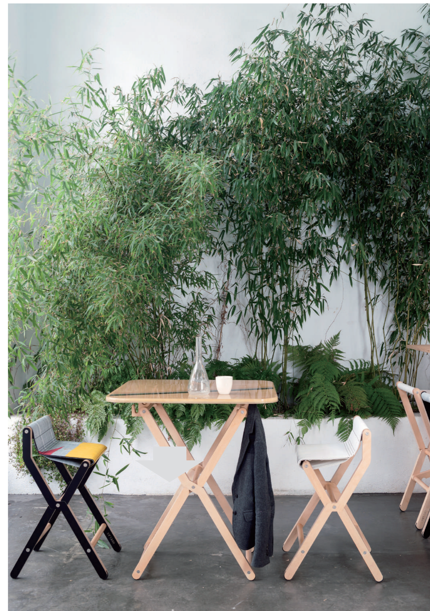
協力: Gate Japan Inc. https://www.gatejapan.jp/

大事ですが、使い方や時間の過ごし方をイメージできれば、どんなものが良いかがわかります。ローメンテナンスな樹脂製のものや、経年変化のあるハードウッド製のものがあるので、雰囲気やお好みで選んでいただけます。