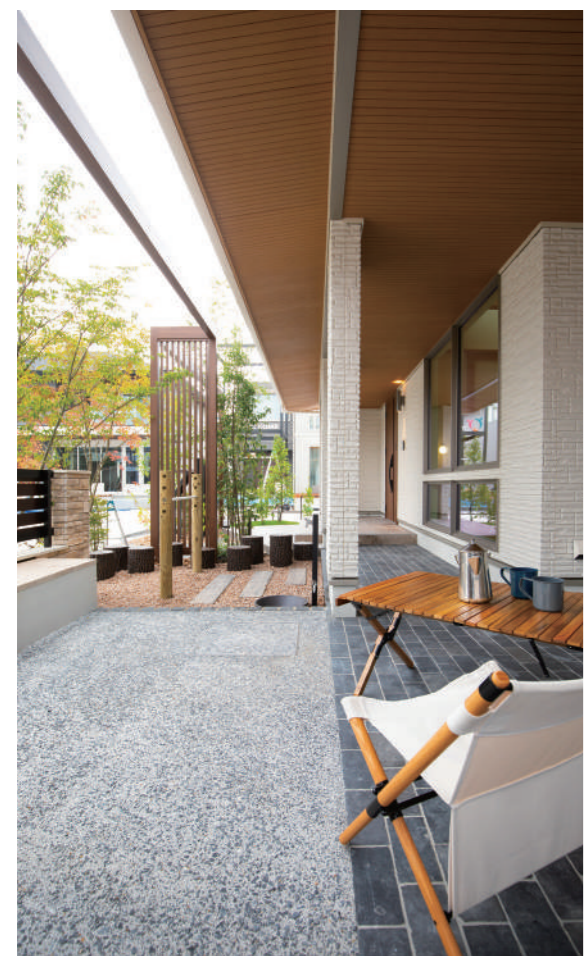
GARDEN & EXTERIOR ESTINA GARDEN AWARD ENTRY WORKS

を考えて、使える空間にしたいものですね。例えば、晴れた日にアウトドアリビングとしてテラス空間を使うなら、エスティナなら夜間のごとまで考えます。ライティングも動線、滞留箇所、植栽や建物の影などを考えてプランニングします。エスティナのホームページには様々な事例が掲載されていますので、ご覧ください。 https://www.estina-style.com/works/