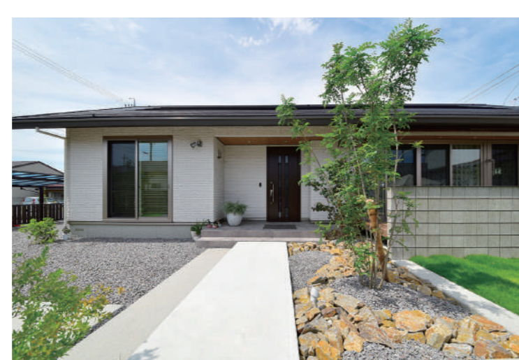
完全に視線を遮る外構と、解放感を重視した外構があります。植栽や自然素材を組み合わせたナチュラルなテイストがトレンドです。

アウトドアリビングとして、住まいの一部となったお庭部分。外構やファサードはどのようにプランしましょうか。外構には完全に外からの視線を遮るような「クローズ外構」と、少し解放感を持たせた「オープン外構」と大きく二つありますが、敷地の形状、建物外観との調和性、暮らしの動線、家族構成、車や自転車の台数など、外構を作るとき